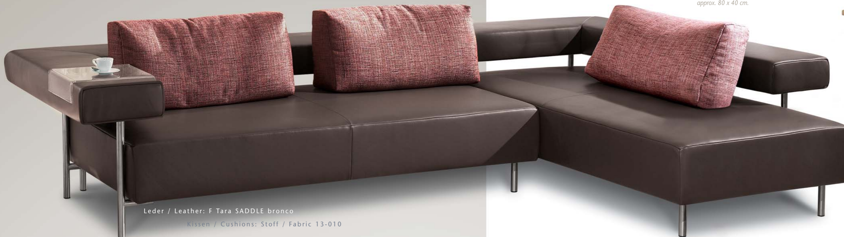
Leder / Leather: F Tara SADDLE bronco