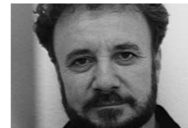
Design KLAUS BERGEN